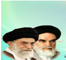
مقام معظم رهبری