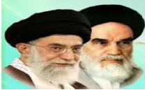
مقام معظم رهبری

امام صادق (ع) مرد مبارزه بود، مرد علم و دانش بود و مرد مشکلات بود.