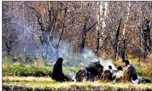
مدیر طرح ساماندهی نازوان بیان داشت: این افزایش بازدیدها برای تابستان اسامیل نیز نسبت به مدت مشابه سال گذشته حدود ۲۵ درصد بوده است. عنوان کرد: پروژه تله‌سکی نازوان، پارک آبی و نمایشگاه تاکسیدرمی نازوان از جمله پروژه‌هایی است که در جهت جذب گردشگر در پارک طبیعی نازوان تأثیر بسزایی خواهد داشت این در حالی است که پروژه تله‌سکی نازوان به بهره‌برداری رسیده است.