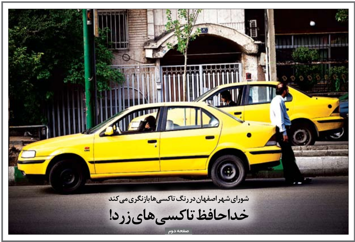
شورای شهر اصفهان در رنگ تاکسی‌ها با زنگری می‌کند خدا حافظ تاکسی‌های زرد!

وزارت کشور اعلام کرده بود این هفته اسامی چهار استاندار جدید اعلام می‌شود اما نمایندگان مجلس می‌گویند هنوز برای انتخاب استاندار اصفهان به نتیجه نرسیده‌اند