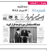
پس از ۱۰۰۰ شماره