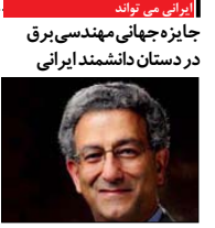
ایرانی می تواند