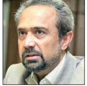
محمد نیاوندیان رییس اتاق بازرگانی ایران

کمسیون صنعت و معنن اتاق بازرگانی اصفهان در سال ۹۲ نیز مانند سال گذشته با هدف بررسی نظرات کارشناسان در خصوص وضعیت اقتصادی روز کشور و اولاً رهاکار به صاحبان سرمایه مسوولان صنعتی‌ها را با عنوان اقتصاد بدون نفت برای اصفهان در نظر گرفته است که اولین جلسه آن با حضور محمد نیاوندیان رییس اتاق بازرگانی ایران برگزار خواهد شد. در این نشست شونده مشکلات و نظرات اعضای اتاق و صاحبان صنعت در استان اصفهان به‌طور مجروح و مستقیم خود را چگونگی دست‌یابی به اقتصاد بدون نفت را در گام اول و دوم اولویت اول مدیریت کلان اقتصادی اجرای اقون بهبود مستمر کار که از قوین جدید کشور در راستای افزایش سهولت کسب و کار به عنوان یک شاخص مهم اقتصادی است را در دستورهای به اقتصاد مردم محور و بدون اتکال به نفت است. در ادامه تحلیل نیاوندیان و نظرات اعضای اتاق اصفهان ارائه می‌شود.