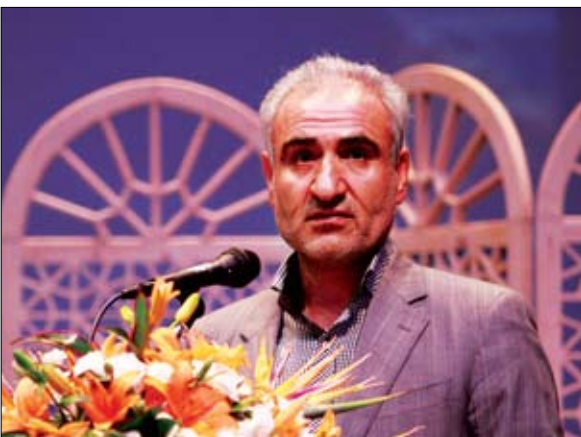
ناصر نقری، شهردار سابق شاهین شهر در ۷۵ ماه فعالیت خود بیش از ۳۰۰ پروژه عمرانی اجرا کرد