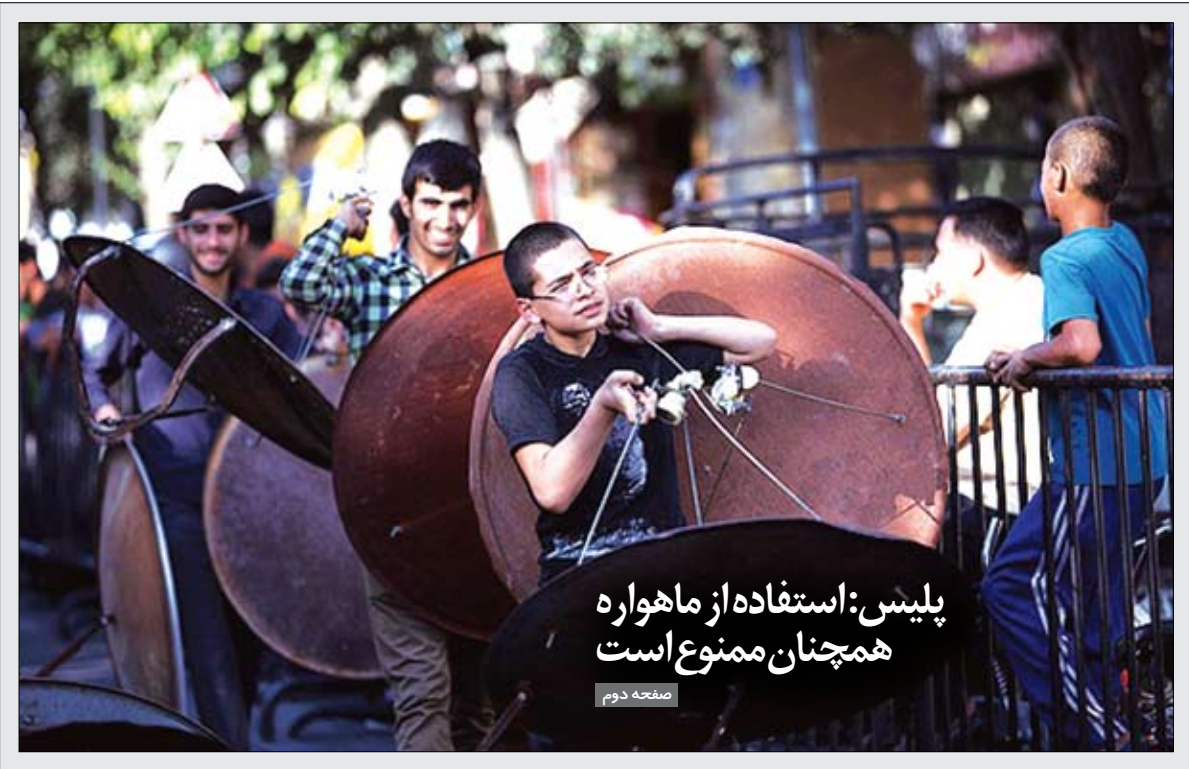
پلیس: استفاده از ماهواره همچنان ممنوع است