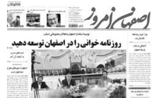
روزنامه خوانی را در اصفهان نوسه جدید

کتاب های خط بریل بسیار کم پیدا می شوند از این رو نابینایان با ادامه تحصیل مشکل دارند و تنها تا سطحی می توانند پیش بروند که کتاب های مخصوص وجود داشته باشد با اینکه کتاب های صوتی و موارد دیگری هم برای این افراد آمده شده است اما با هم مشکلات درس خواندن همیشه وجود داشته است به گزارش باشگاه خبرنگاران، "یونگ جیونگ" طراح کره ای است که به تازگی یک انگشتر بسیار جالب و کاربردی برای نابینایان طراحی کرده است که می تواند علم و سطح آموزش را میان این افراد به طرز قابل توجهی رشد دهد این انگشتر که به "رینگ چشم" شناخته می شود توانایی آن را دارد تا حروف را به خط بریل تبدیل کند و از طریق رابط های حساس آن را به انگشتان فرد نابینا می رساند این باعث می شود تا یک نابینا دیگر تنها به کتاب های بریل اکتفا نکرده و همه کتاب ها را بخواند این انگشتر به صورت یک اسکنر کار خواهد کرد زیرا بر روی آن یک دوربین قرار داده شده که حرف را تشخیص داده و به مرکز پردازش ارسال می کند.