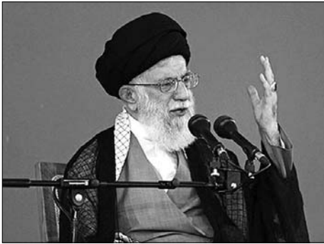
مدیران پیش برود!