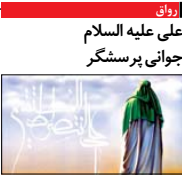
روزان علی علیه السلام جوانی پرشگرم