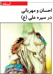
احسان و مهربانی در سیره علی (ع)