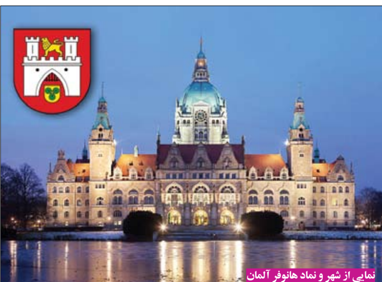
نمایی از شهر و نماد هانوفر آلمان

HYTERA، ماشین سازی EMF مهندسی و مشاوره سالز گیتز از ایالت نیدرزاکسن از جمله افرادی بودند که در صدر هیأت