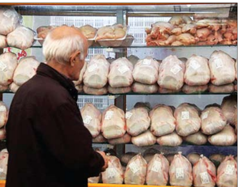
درج شده است پیگیری موارد به انجام رسانند

همانند روال قبل مردم می‌توانند با مرکز تماس شرکت‌های ارائه‌دهنده خدمات پرداخت که روی رسید دستگاه کارت‌خوان حاصل کنند