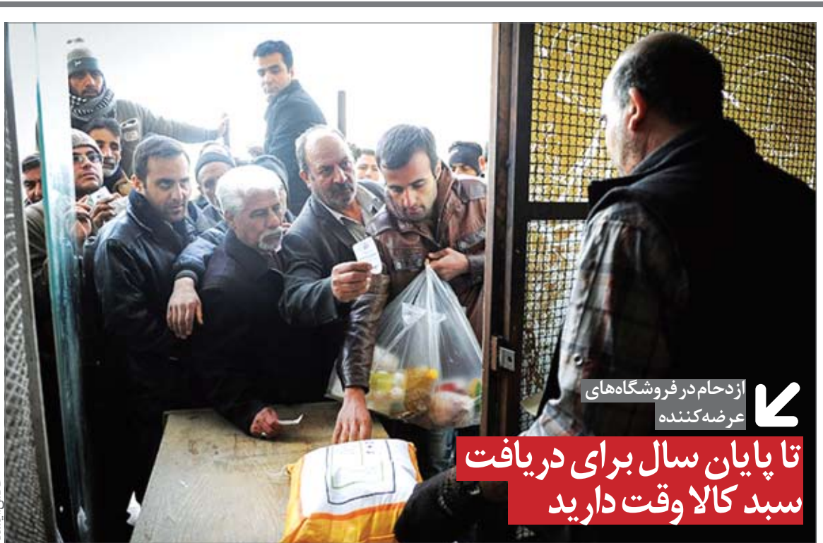
از دحام در فروشگاه‌های عرضه‌کننده