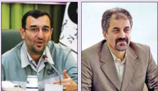
صنعت و معدن، مدیریت عامل سیمان ارومیه مدیریت عامل و عضویت هیأت مدیره سنگ گل گهر و معاونت امور صنایع و معدن وزارت صنایع و معادن را در کارنامه داشت.

هدف اصلی نمایشگاه کاهش مصرف سوخت، مهندسی دما و انرژی و بهینه‌سازی مصرف سوخت با استفاده از آخرین استانداردهای صنعت، معدن و تجارت استان اصفهان موضوعی است که تولیدکنندگان را برای ساخت محصولات جدید و نمایش آن در عرصه‌های نمایشگاهی ترغیب می‌کند چرا که مدیریت انرژی برای جهان امروز از اهمیتی فوق‌العاده برخوردار است. در این نمایشگاه‌ها سعی می‌شود آخرین نمونه‌ها، به‌روزترین و استانداردترین آنها به نمایش درآید تا علاوه بر افزایش سطح آگاهی متخصصین، مردم و خریداران نیز فرهنگ مصرف خود را در زمینه خرید کالای استاندارد، به روز، ایمن و با مصرف سوخت مناسب ارتقاء دهند.