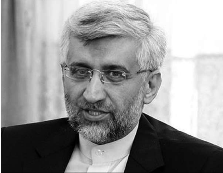
سعید جلیلی، عضو شورای عالی امنیت ملی که در دقیقه ۹۰ برای سخنرانی مراسم ویژه روز ۱۲ آبان جایگزین عزت-ا- ضرغامی شد.