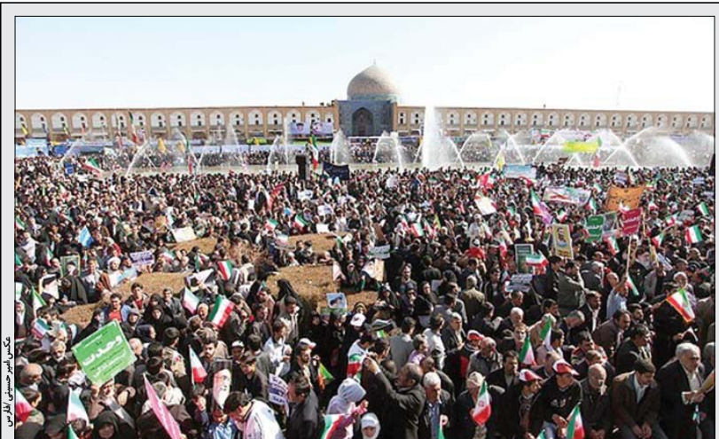
عکس اثر سیدعلی الماسی