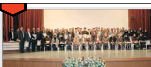
پژوهش و فناوری از زاویه‌ای دیگر