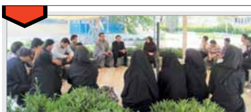
موج فرهنگ و اندیشه در حوزه معاونت فرهنگی