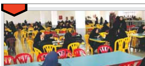
رئوس برنامه‌های حوزه معاونت دانشجویی