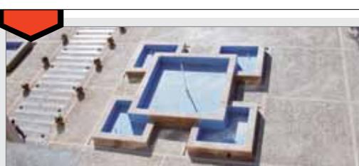
توسعه محوری و معاونت عمرانی