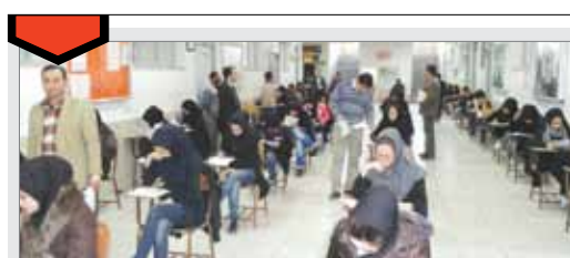
حوزه معاونت آموزشی