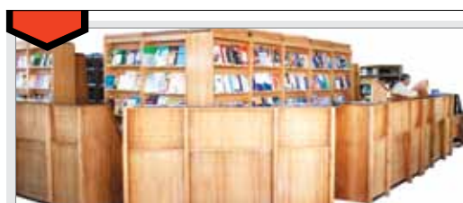
نمایی از ظرفیت‌ها و فرصت‌های دانشکده‌های واحد اصفهان (خوراسگان)