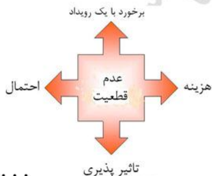
شکل ۱. متغیرهای دارای عدم قطعیت در شرایط ریسک