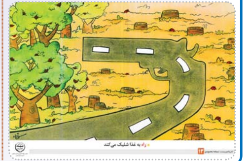
راه به غذا شلیک می گند