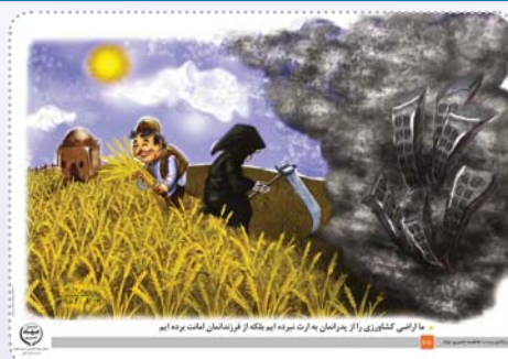
با ارضی کشاورزی از پارکمن به ارت نهمه ایم هتکه از فرزندمان داشت نهمه ایم