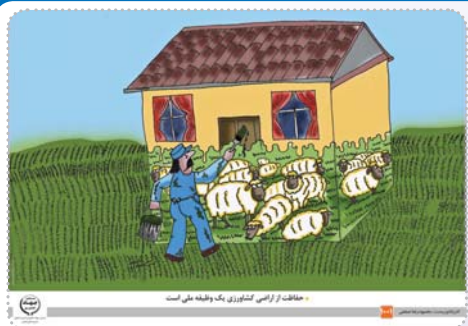
حالت از ارضی کشاورزی یک منطقه ملی است