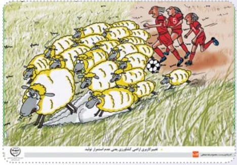
مصرف آب در ارضی کشاورزی می هم دستور بود