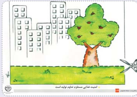
امنیته غذایی مستلزم تولید ملی است