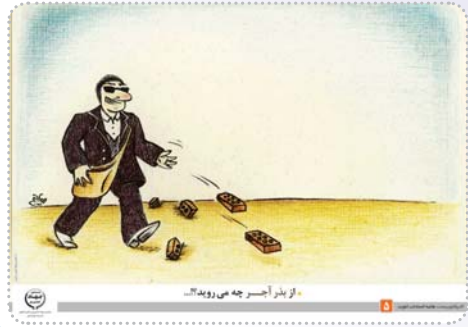
با دلار آجر چه می روید...