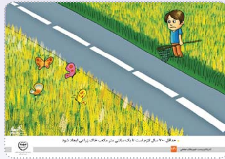
حداقل ۷۰۰ تن از یک ماسک شتر مکتب عاقل زراعی ایجاد شود