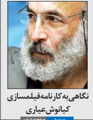
نگاهی به کارنامه فیلمساز کیانوش عیاری